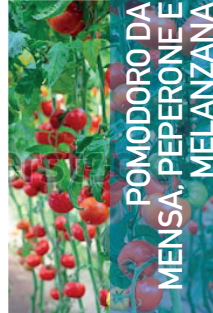
POMODORO DA MENZA, PEPERONE E MELANZANA

Applicazione fogliare: In pre trapianto 20g/10L su piantine, Da fioritura primo palco 50g/ ha Numero interventi: 5-6 Intervallo minimo: 7-14 giorni Invaatura 50-70% 100g/ha Numero interventi: 1