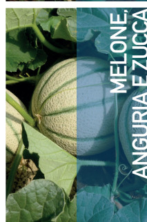
MELONE, ANGURIA E ZUCCA

Applicazione fogliare: In pre trapianto 20g/10L su piantine, Da post trapianto 50g/ha Numero interventi: 6-10 Intervallo minimo: 7-10 giorni