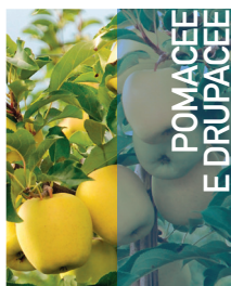
POMACEE E DRUPACEE

Applicazione fogliare: Da post trapianto: 100-200 g/ha Numero interventi: 2-3 Intervallo minimo: 7-10 giorni