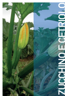
ZUCCHINO E CETRIOLO

Applicazione fogliare: Da pre-fioritura 50-100 g/ha, Numero interventi: 6-8 Intervallo minimo: 7-10 giorni